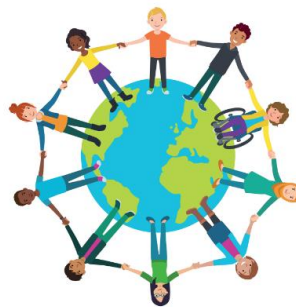
We zijn allemaal anders

In dit blok willen we de kinderen leren oog te hebben voor verschillen en overeenkomsten tussen mensen. De kinderen leren dat je verschillen en overeenkomsten terugziet binnen de eigen families, de klas, de school en de samenleving. Door een positieve aanpak laten we de kinderen ervaren dat verschillen vanzelfsprekend zijn in plaats van eng of vreemd.