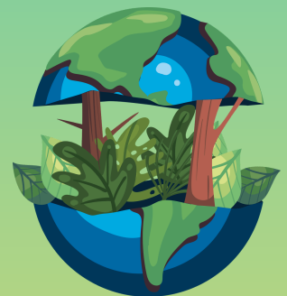
Interactie en adaptatie