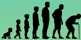
Groei en ontwikkeling